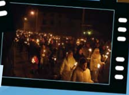
Fiaccolata per la pace a Gaza