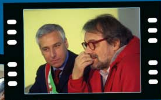
Inaugurazione della mostra "Sant'Anna di Stazzema 12 agosto 1944:i bambini ricordano" di Oliviero Toscani