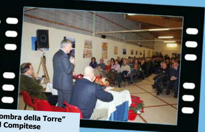
Presentazione del Libro "All'ombra della Torre" al Frantoio Sociale del Compitese