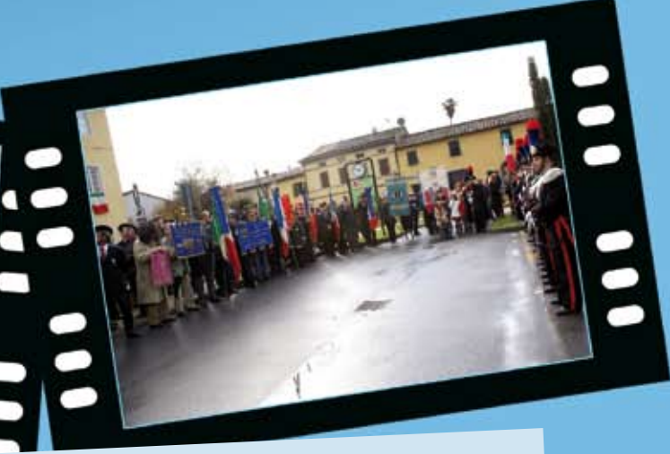
Intitolazione della piazza di Lammary ai Caduti di Nassirya