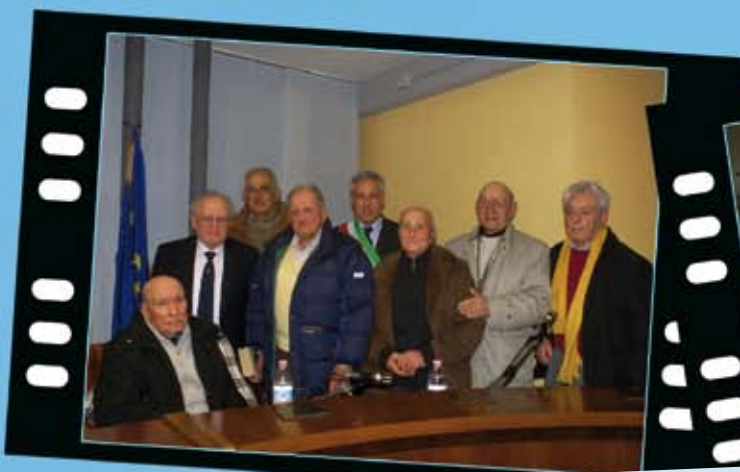
Consiglio comunale straordinario sul "Giorno della memoria"