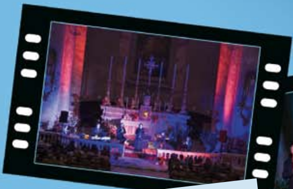
Concerto di Antonella Ruggiero alla chiesa parrocchiale di Lammari