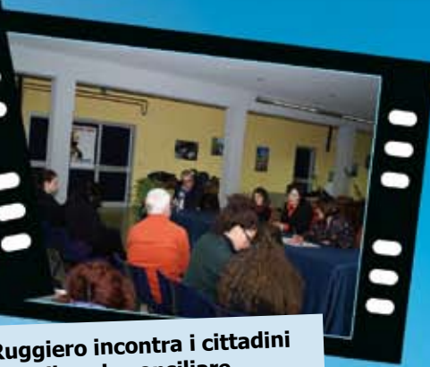
La Ruggiero incontra i cittadini nella sala consiliare