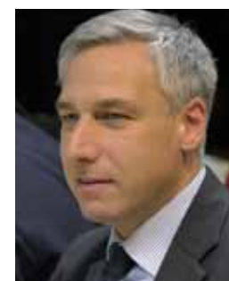
Giorgio Del Ghingaro sindaco

Ricevimento: su appuntamento Contatti: tel. 0583/428211 Fax: 0583/428336 Email: sindaco@comune.capannori.lu.it