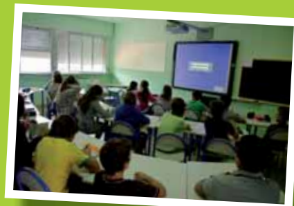
Scuola secondaria di Camigliano: è stata riqualificata un'ala dell'istituto, che ha preso il nome di Area dell'accoglienza e dell'innovazione. I nuovi spazi, a misura di bambino e dotati di moderni strumenti didattici quali le lavagne interattive multimediali (LIM), ospitano le quattro classi prime.