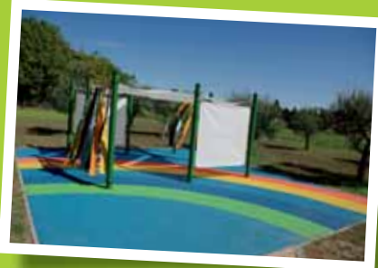
Scuola primaria di Capannori: è stata realizzata un'area da gioco nel giardino della scuola. Si tratta di uno spazio in mezzo al verde dotato di un'area gommata colorata e riparata dal sole grazie ad alcuni teli, che permette ai bambini di divertirsi in sicurezza.