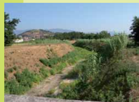
Ecco come appariva il Rio Leccio solo una manciata di giorni prima della bomba d'acqua del 9 ottobre scorso

Una bomba d'acqua, con punte di 110 millimetri di pioggia precipitata in appena quaranta minuti, si è abbattuta nella mattinata dello scorso 9 ottobre sulla cintura sud del comune di Capannori, sull'Oltreserchio e sui Monti Pisani. È come, tanto per intendersi, se su questa