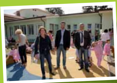
Scuola dell'infanzia di Marlia: il plesso è stato interessato da vari interventi migliorativi. Nel giardino è stata installata un'area in gomma colorata variopinta assieme a una figura d'animale e ad alcuni giochi, dove i piccoli possono divertirsi in tutta sicurezza. L'area, inoltre, è stata arricchita con terreno vegetale, che è stato livellato. È poi stata sistemata la recinzione esterna e si è installato un nuovo cancello.

e modalità del primo con la costituzione di un comitato di garanzia, la realizzazione di una bozza di bilancio sociale per esplicitare i risultati raggiunti dal comune nel 2011. Sarà la base informativa su cui verrà effettuata la discussione da distribuire ai cittadini. Prima dello svolgimento dei 4 World Cafè tematici i cittadini saranno suddivisi in quattro gruppi ed elaboreranno alcune prime idee progettuali che saranno poi tradotte in progetti veri e propri e successivamente votati da tutti i cittadini. I progetti scelti saranno poi realizzati dall'Amministrazione Comunale.