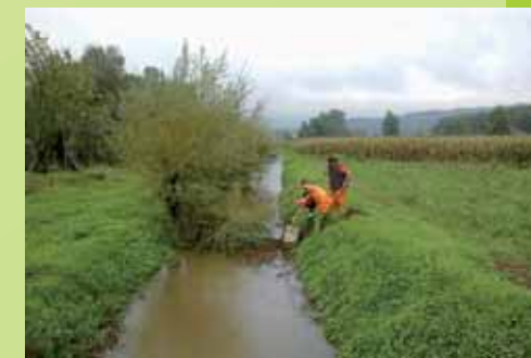
Un momento dell'evento alluvionale del 9 ottobre scorso