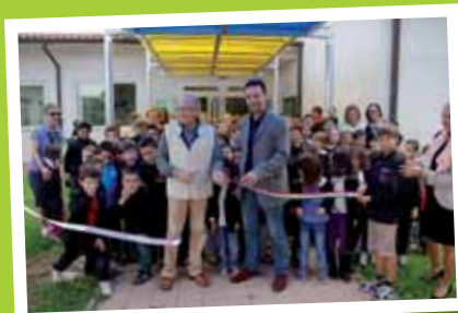
Scuola primaria di Colle di Compito: l'intervento più importante ha riguardato l'installazione di una pensilina di collegamento tra il cancello principale e l'ingresso. È dotata di una copertura trasparente colorata, che consente agli alunni, agli insegnanti e al personale di accedere al plesso senza bagnarsi in caso di pioggia.