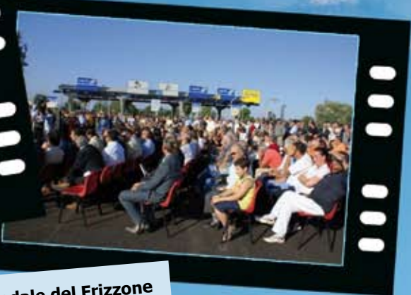
Inaugurazione del nuovo casello autostradale del Frizzone