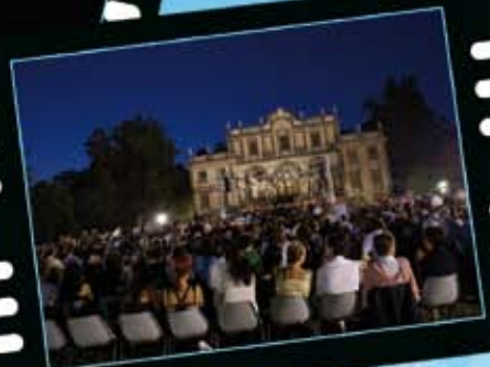
Il concerto di Giovanni Allevi a Villa Mansi