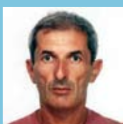
Moreno Da Collina

Con l'inizio della stagione invernale ancora una volta ci troveremo a convivere con la presenza delle polveri sottili nell'aria con valori superiori ai limiti di legge. L'esistenza nell'aria di queste microparticelle (PM10) della grandezza d'alcuni micron, è dovuta principalmente all'utilizzo come fonti di riscaldamento di carbone, gasolio, e legno o alle alte intensità di traffico veicolare ed in particolare alle emissioni dei motori diesel e dei ciclomotori, mentre una percentuale minore è causata dall'usura dei freni e dei pneumatici. Gli effetti delle polveri sottili per la nostra salute sono devastanti. Le PM10 si insinuano nel nostro organismo attraverso le vie respiratorie giungendo, quando il loro diametro lo permette, direttamente negli alveoli polmonari, le particelle più grosse provocano irritazione e infiammazione delle vie respiratorie superiori, mentre quelle di dimensioni minori possono provocare ed aggravare malattie respiratorie ed in alcuni casi indurre formazioni neoplastiche.