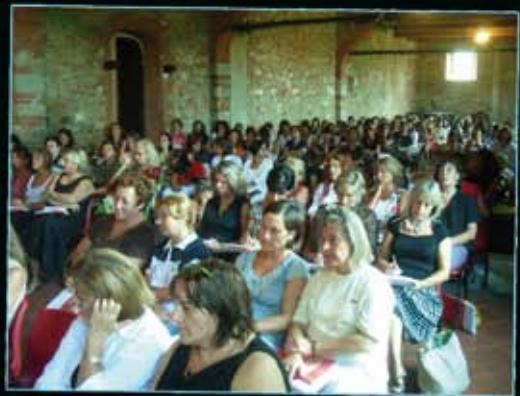
Settembre Pedagogico 2008: il convegno di apertura