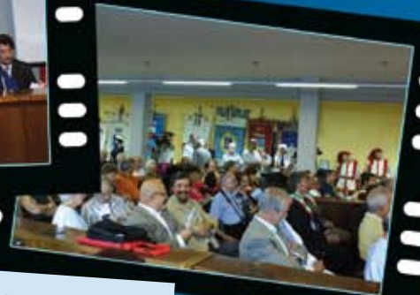
Le celebrazioni della 'Quinta Giornata dei Toscani all'Estero'