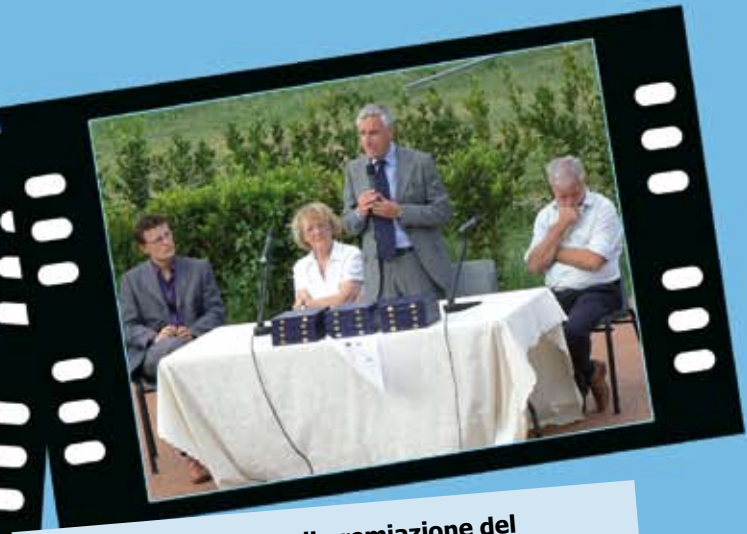
La cerimonia di premiazione del 'Premio Comuni a 5 stelle'