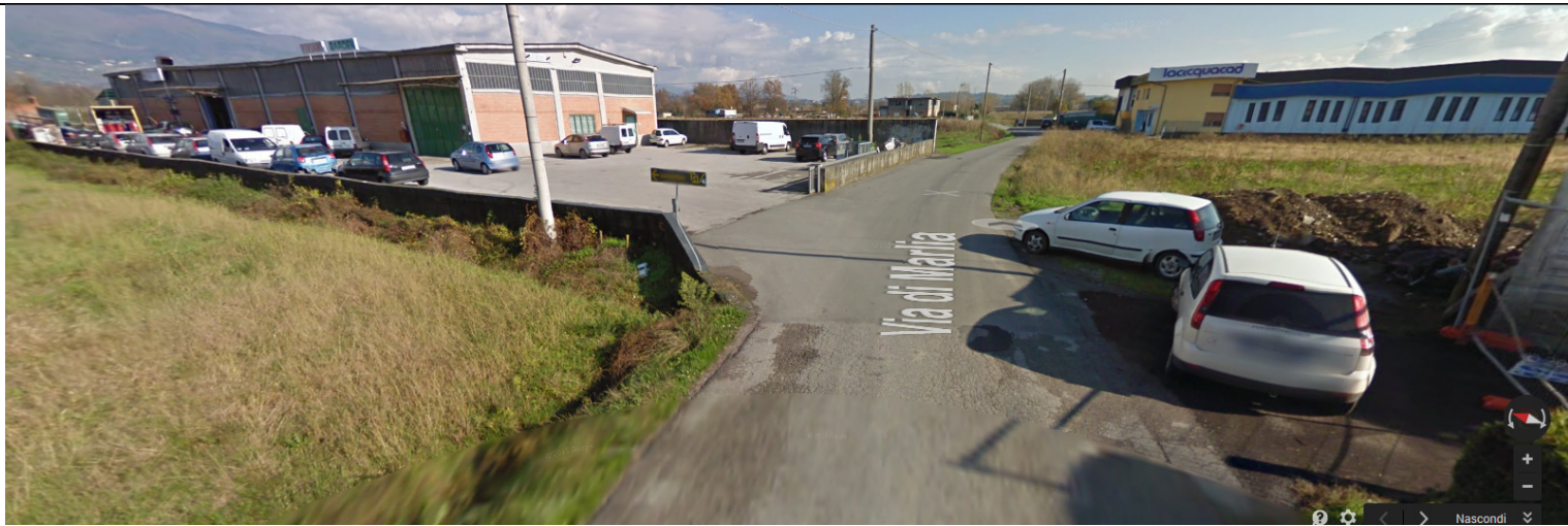
Via di Marlia